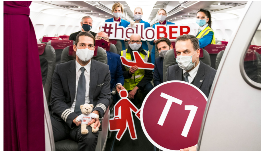
Erste Ankünfte am BER: Mit #helloBER wurden die Airlines am neuen Flughafen begrüßt.

Am 4. November wurde mit der Landung des Qatar-Airways-Fluges QR81 aus Doha die südliche Start- und Landebahn des BER eröffnet. Damit war der BER im Sinne des Planfeststellungsbeschlusses vollständig in Betrieb genommen. Mit der Inbetriebnahme der Südbahn greift die Nachtflugregelung, die reguläre Linienflüge in der Kernnachtzeit von 0 bis 5 Uhr ausschließt und in den Tagesrandzeiten von 22 bis 24 Uhr sowie von 5 bis 6 Uhr nur ein behördlich festgelegtes Kontingent von Flügen ermöglicht. Zudem begann mit dem parallelen Betrieb beider Start- und Landebahnen am BER die 180-tägige Frist für die Schließung des Flughafens Tegel.