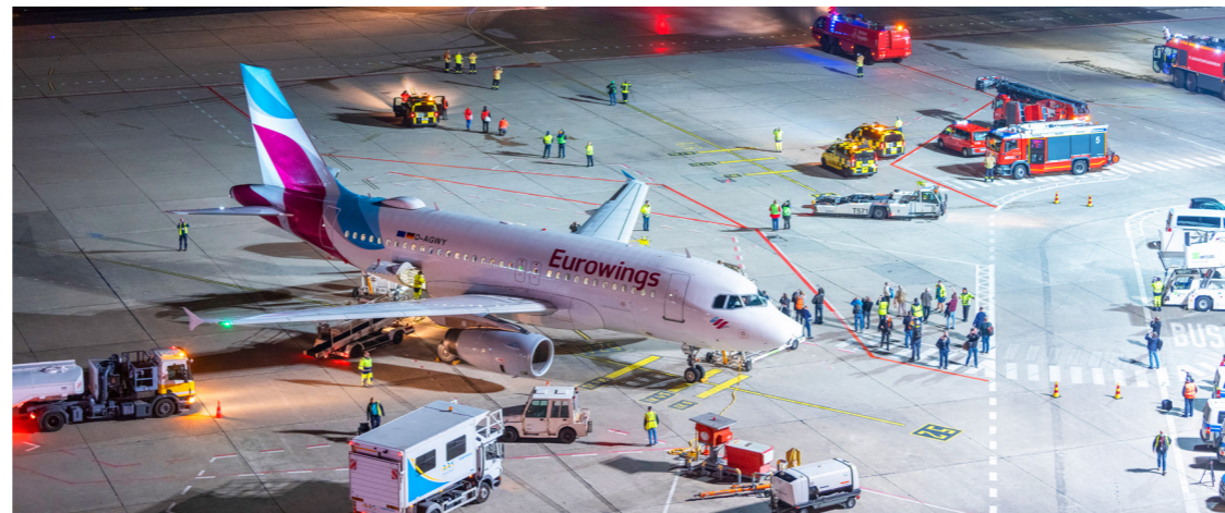
Großer Andrang: Unter den Augen zahlreicher Zuschauer hoben die letzten Linienflieger am 7. November 2020 vom Flughafen TXL ab.