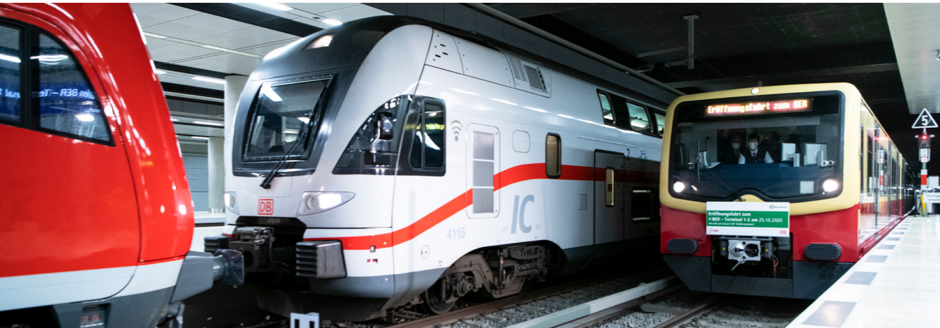
Der Berliner Hauptbahnhof wird mit dem Regionalverkehr der Deutschen Bahn mindestens viermal pro Stunde angefahren; zusätzlich verkehren die S-Bahn-Linien S9 und S45 jeweils alle 20 Minuten nach Berlin.