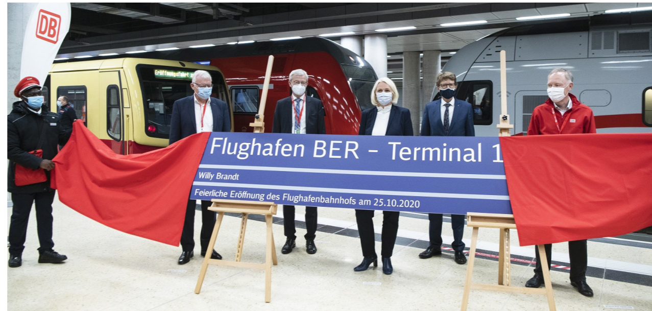
Der Flughafenbahnhof „Flughafen BER – Terminal 1-2“ liegt direkt unter dem Terminal 1, verfügt über sechs Gleise und mit der Inbetriebnahme ist der BER gut an das Schienennetz des Regional- und Fernverkehrs angebunden.

Die Eröffnung des T1 war nicht der einzige Schritt auf dem Weg zur vollständigen Inbetriebnahme. Mit der Inbetriebnahme des Bahnhofs „Flughafen BER Terminal 1-2“ wurde der BER am 25. Oktober 2020 an das Schienennetz angebunden. Der Bahnhof befindet sich direkt unter dem Terminal 1 in der Ebene U2. Die Besonderheit am BER ist, dass Fluggäste direkt mit dem Zug oder der S-Bahn unter dem Terminal ankommen und abfahren können. Die gute Anbindung an das öffentliche Verkehrsnetz ermöglicht eine unkomplizierte, schnelle und umweltschonende An- und Abreise.