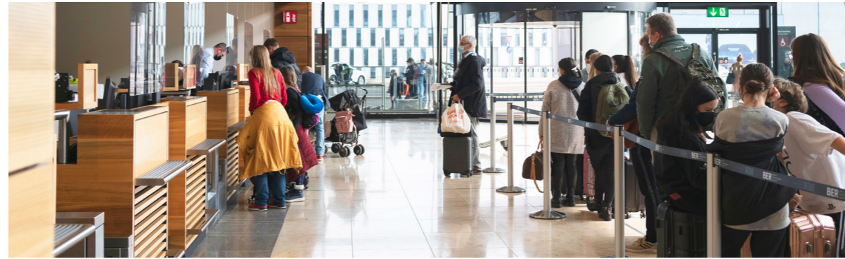
Sicher fliegen unter Corona-Bedingungen: Mit zahlreichen Maßnahmen in den Terminals wird sichergestellt, dass die Passagiere am Flughafen auch unter Corona-Bedingungen gesundheitlich sicher ihren Flug antreten können.

neue Jahr ging die Zahl der Fluggäste auf Grund des verschärften Lockdowns und der weltweiten Reisebeschränkungen noch einmal drastisch zurück. Wegen des geringen Flugbetriebs ist das Terminal 5 des BER ab 23. Februar 2021 vorübergehend geschlossen. Damit fertigen momentan alle Airlines ihre Passagiere in Terminal 1 ab. Bei einer Erholung der Fluggastzahlen können mit den Terminals 2 und 5 zusätzliche Gebäude für die Abfertigung der Passagiere in Betrieb genommen werden. Die Corona-Pandemie führte auch im Flughafenbetrieb zu zusätzlichen Hausforderungen, insbesondere zur Umsetzung und strikten Einhaltung der Hygienemaßnahmen. Dazu gehörten neben der Ausstattung der Terminals mit Plexiglasscheiben, Abstandsmarkierungen oder Desinfektionsmittelspendern auch die regelmäßige Desinfektion von Oberflächen in den Check-in-Bereichen, Warteräumen oder Aufzügen. Für höchstes Niveau in punkto Hygiene und Einhaltung der Gesundheitsbestimmungen wurde der BER bereits mit zwei Zertifikaten des internationalen Flughafenverbandes ACI (Airports Council International) ausgezeichnet.