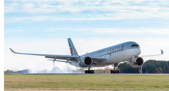
Mit der Landung des Qatar-Airways-Fluges QR81 aus Doha wurde am 4. November 2020 die südliche Start- und Landebahn des BER in Betrieb genommen.

Mit der ersten Landung auf der südlichen Start- und Landebahn wurde der Flughafen BER vollständig in Betrieb genommen und die Nachtflugregelung trat in Kraft. Es war auch der Startschuss für die sechsmonatige Frist für die endgültige Schließung des Flughafens Tegels.