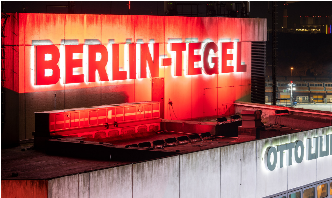
Bye-bye, Tegel Airport: Am 8. November wurde am Flughafen symbolisch das Licht ausgeschaltet.