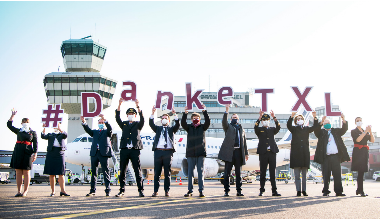
Mit dem letzten Abflug von Air-France-Flug AF1235 endete die Flughafengeschichte von Tegel.