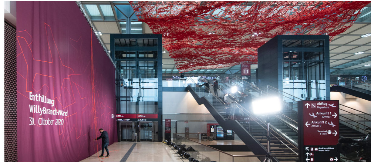
Der BER trägt den Namen von Willy Brandt, einem der herausragenden Staatsmänner des 20. Jahrhunderts.