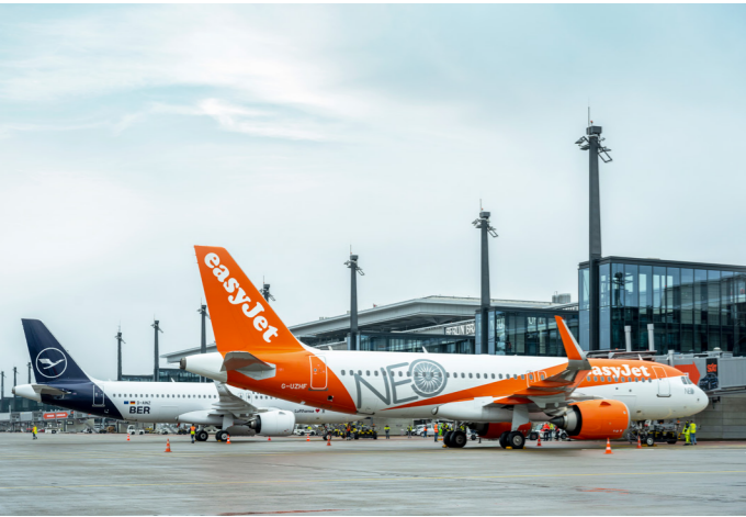
Wasserfontäne zur Begrüßung: Die Sonderflüge EJU3110 und LH2020 trafen sich nach der Landung vor dem Terminal 1. Die Flugnummern bildeten das Eröffnungsdatum.