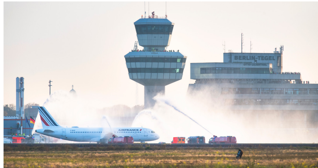
Flug AF1235 wurde mit einer Wasserfontäne vom Flughafen Tegel verabschiedet.