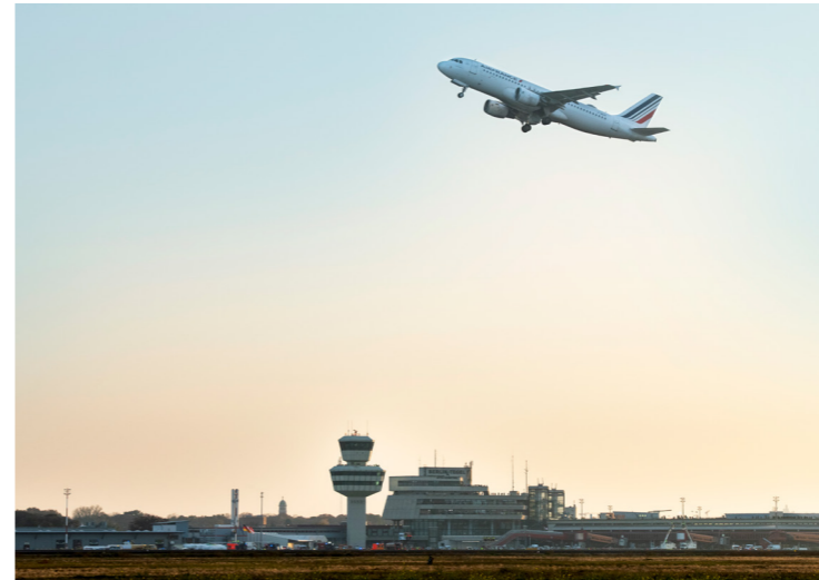
Sieben Jahrzehnte nach dem ersten Linienflug startete ein Flugzeug der französischen Airline Air France zum allerletzten Mal ab Tegel in Richtung Paris Charles de Gaulle.