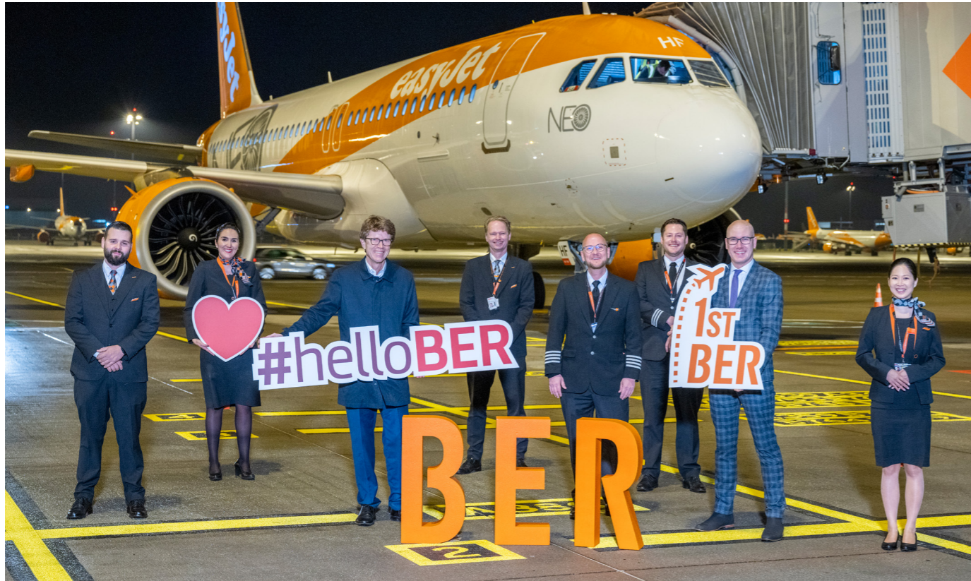
Erster Abflug am BER: Mit #helloBER wurden die Airlines am neuen Flughafen begrüßt.

Einen Tag nach der offiziellen Eröffnung begann der Regelbetrieb am BER. Um kurz vor 7 Uhr startete der erste Flug, easyJet-Flug EJU8210, nach London-Gatwick.